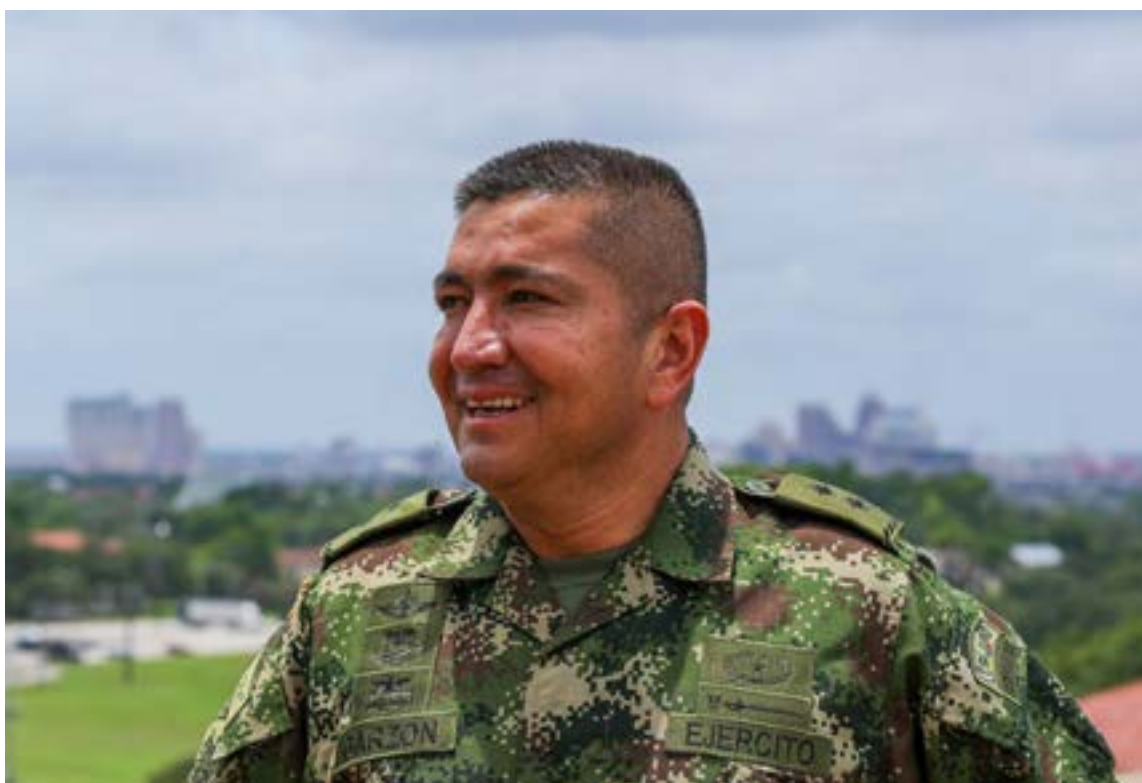
La orden de Petro llega en un momento de incertidumbre, ya que no se han hecho públicos los detalles específicos de los indicios que pesan sobre el general.

pesar de que Garzón fue investigado en 2020 por presunto acoso laboral y sexual —caso que fue archivado—, la actual acusación por nexos con el narcotráfico genera una nueva ola de controversia, poniendo en tela de juicio la confianza en una de las figuras que lideraba el combate a las mafias en el país.