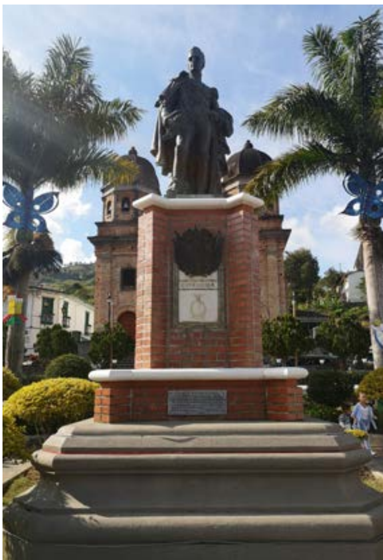
Monumento al general José María Córdova Muñoz

La formación en ingeniería militar le proporcionó a Córdova una comprensión profunda sobre la construcción y asedio de