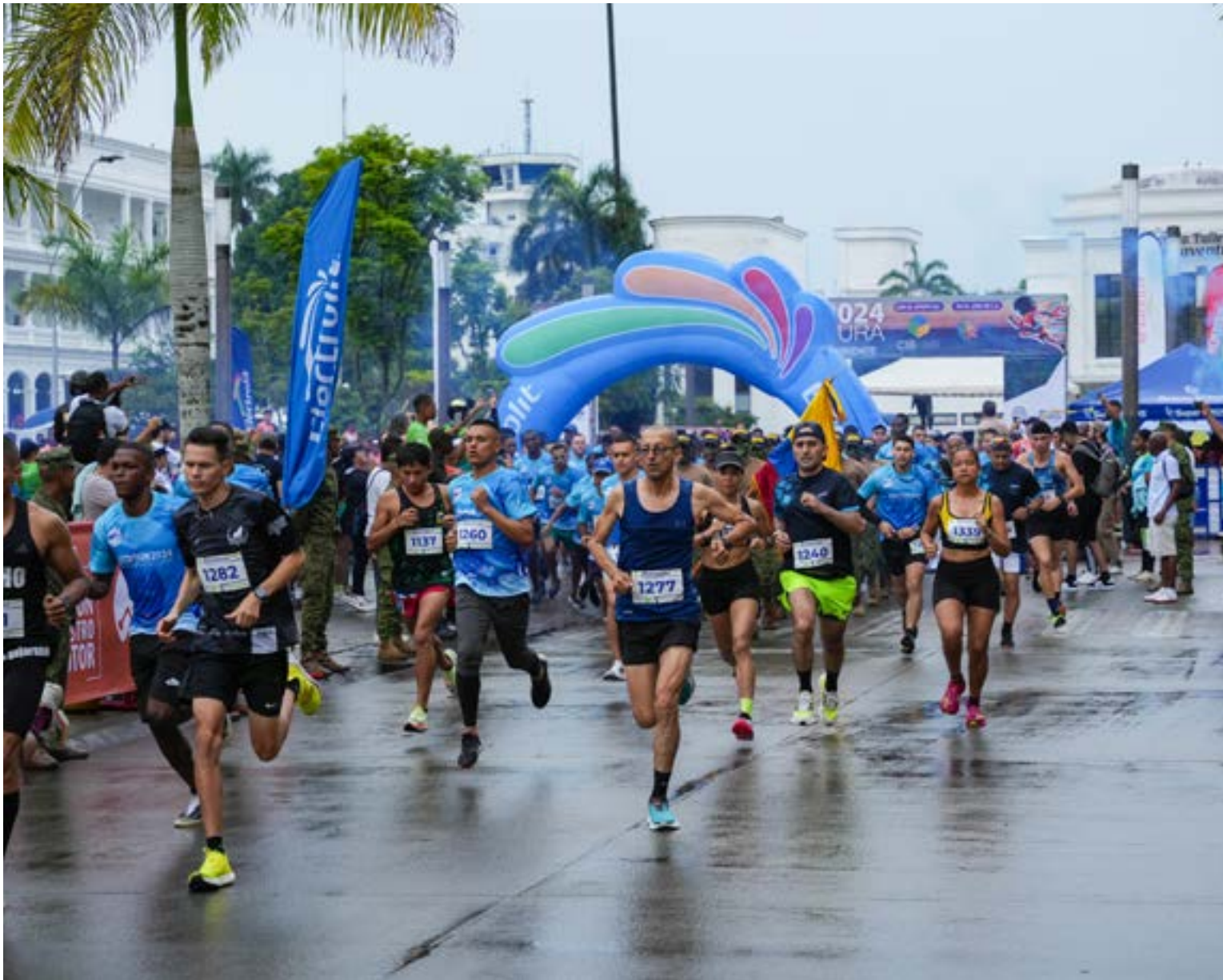
2.500 corredores participarán en la quinta edición de su carrera atlética «Buenaventura Corre por su identidad 2025»

Víctor Ocoró Buenaventura-Valle del Cauca