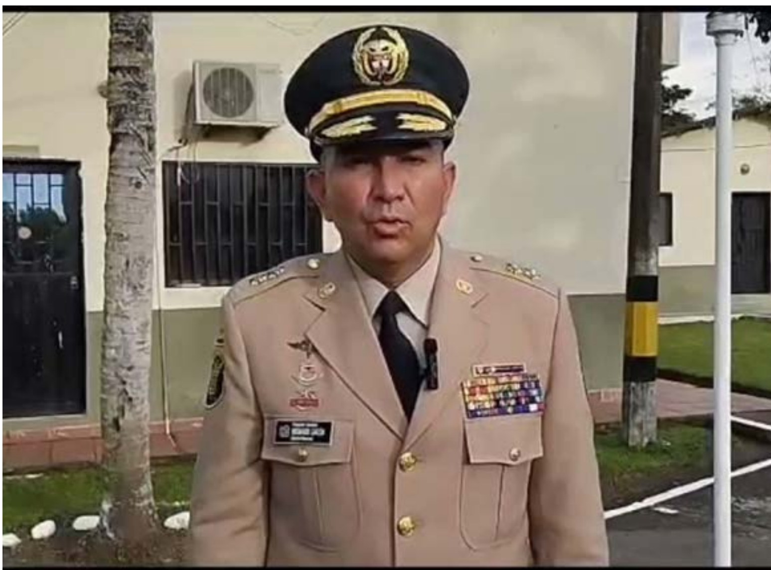
Hernando Garzón Rey, mayor general

La orden de Petro llega en un momento de incertidumbre, ya que no se han hecho públicos los detalles específicos de los indicios que pesan sobre el general. A