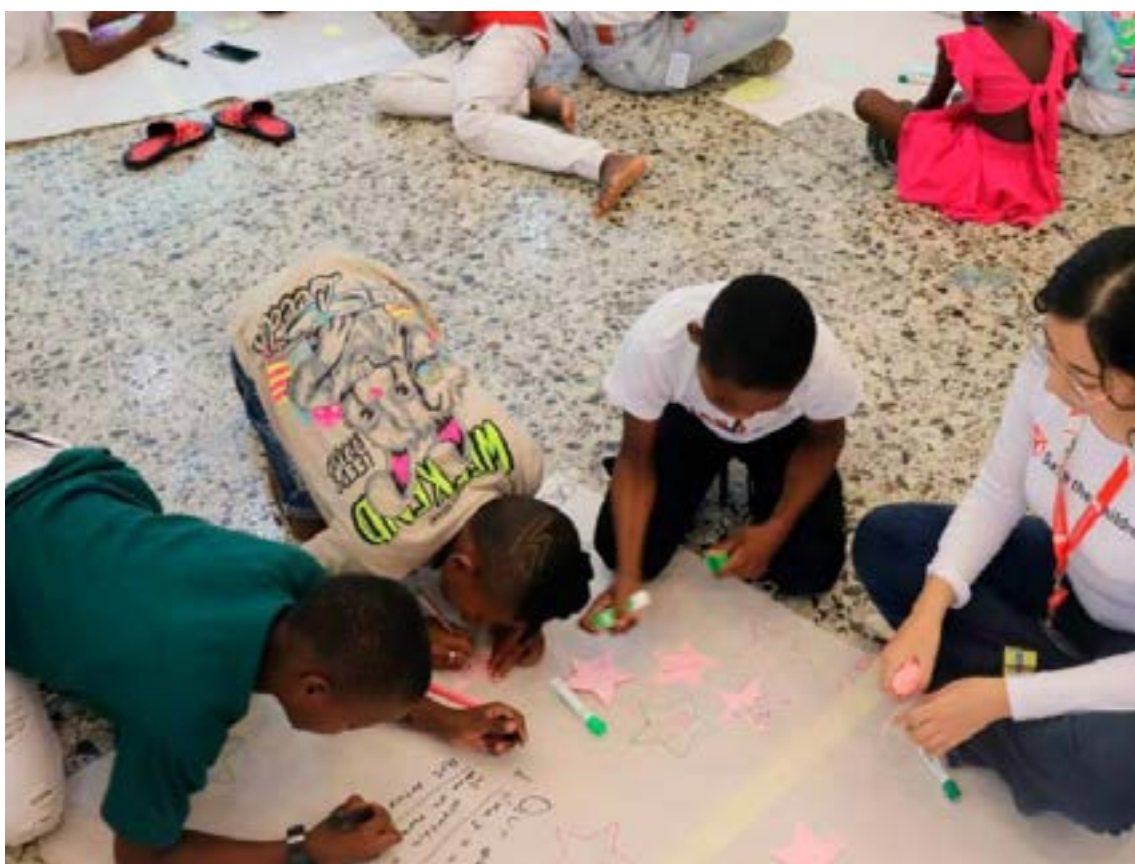
En un emotivo acto, el Gobierno Nacional rindió homenaje a los niños y adolescentes afectados por los conflictos, tanto en Colombia como en Palestina.

En un emotivo acto, el Gobierno Nacional rindió homenaje a los niños y adolescentes afectados por los conflictos, tanto en Colombia como en Palestina. Este enfoque dual visibilizó las terribles violaciones de derechos que sufre la población infantil, incluyendo el desplazamiento forzado,