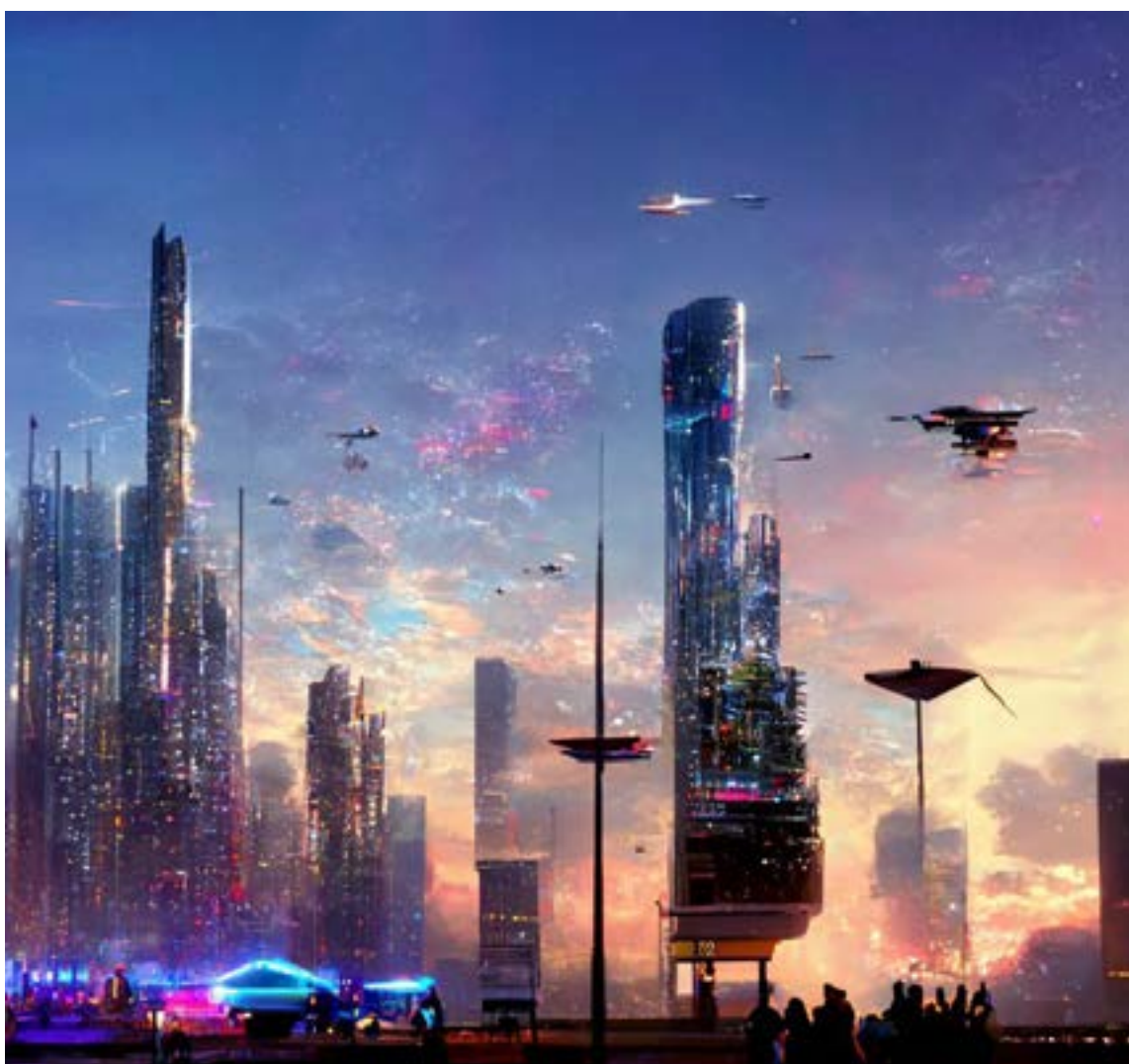
El proyecto promueve la inversión en investigación, la creación de «sandbox regulatorios» para la experimentación segura, y la integración de la educación en IA, con un enfoque en el desarrollo regional y la transición laboral justa.

La propuesta legislativa, inspirada en estándares internacionales pero adaptada al contexto colombiano, aborda puntos clave: Se categorizan los sistemas de IA para regular su uso. Aquellos de «riesgo crítico» que puedan vulnerar derechos fundamentales (como la manipulación subliminal) quedarían prohibidos, mientras que los de «alto riesgo» (en salud o edu-