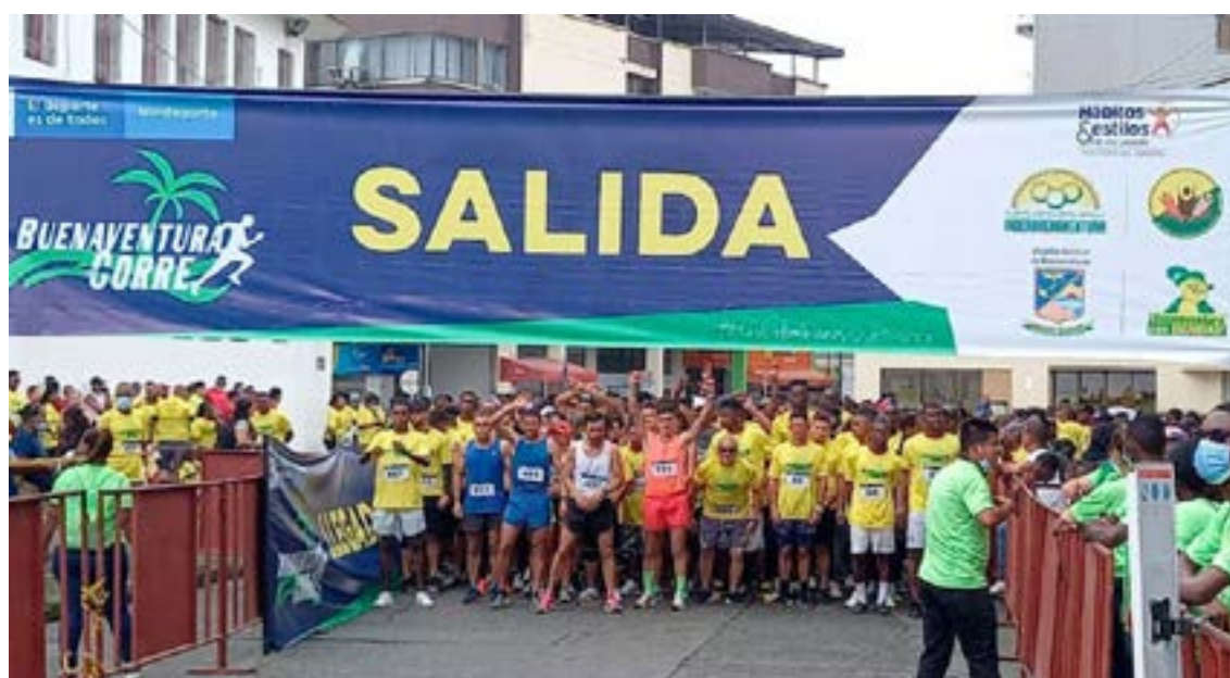
La organización del evento, a cargo del Ministerio del Deporte en colaboración con el Comité del Paro Cívico, el INDER y la Alcaldía Municipal, ha dispuesto una inversión de más de 400 millones de pesos para esta edición.

La ciudad de Buenaventura se prepara para recibir a 2.500 corredores en la quinta edición de su carrera atlética «Buenaventura Corre por su identidad 2025». El evento, programado para el 12 de octubre, no solo busca promover el deporte y la actividad física, sino también fortalecer el sentido de pertenencia y resiliencia de la comunidad bonaverense.