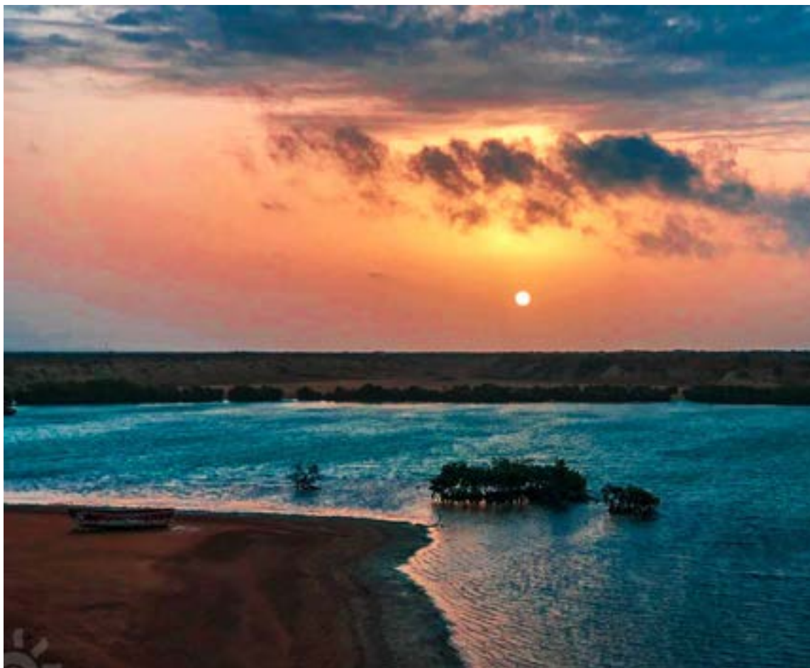
Espectacular paisaje de Punta de Gallinas el sitio donde empieza Colombia.

Algunos visitantes consideran que es el sitio perfecto para escaparse de la rutina y disfrutar de un ambiente tranquilo, vivir