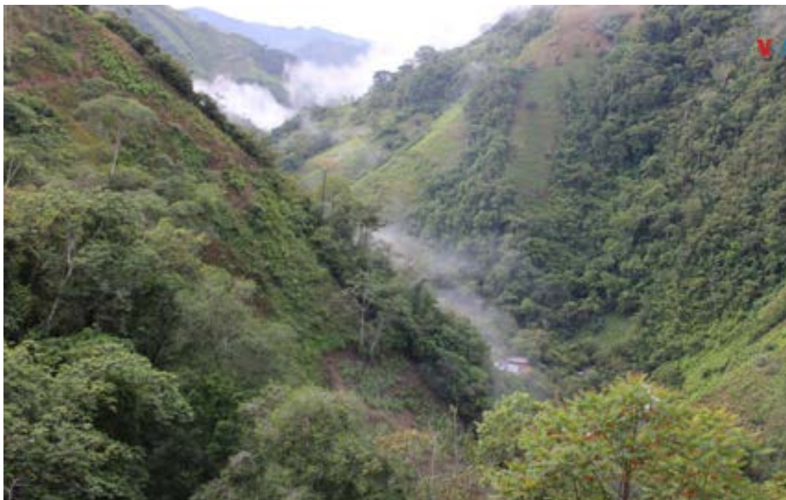
Cañón del Micay donde se libra una intensa guerra.

El cañón de Micay, es bañado por diversos afluentes tanto en la parte del río Micay, como del río Naya, que forman en su recorrido Deltas e Islas cubiertas por vegetación exuberante adornando así el paisaje y una variedad de Ecosistemas relacionado con los esteros y las quebradas, lo mismo la flora y la fauna.