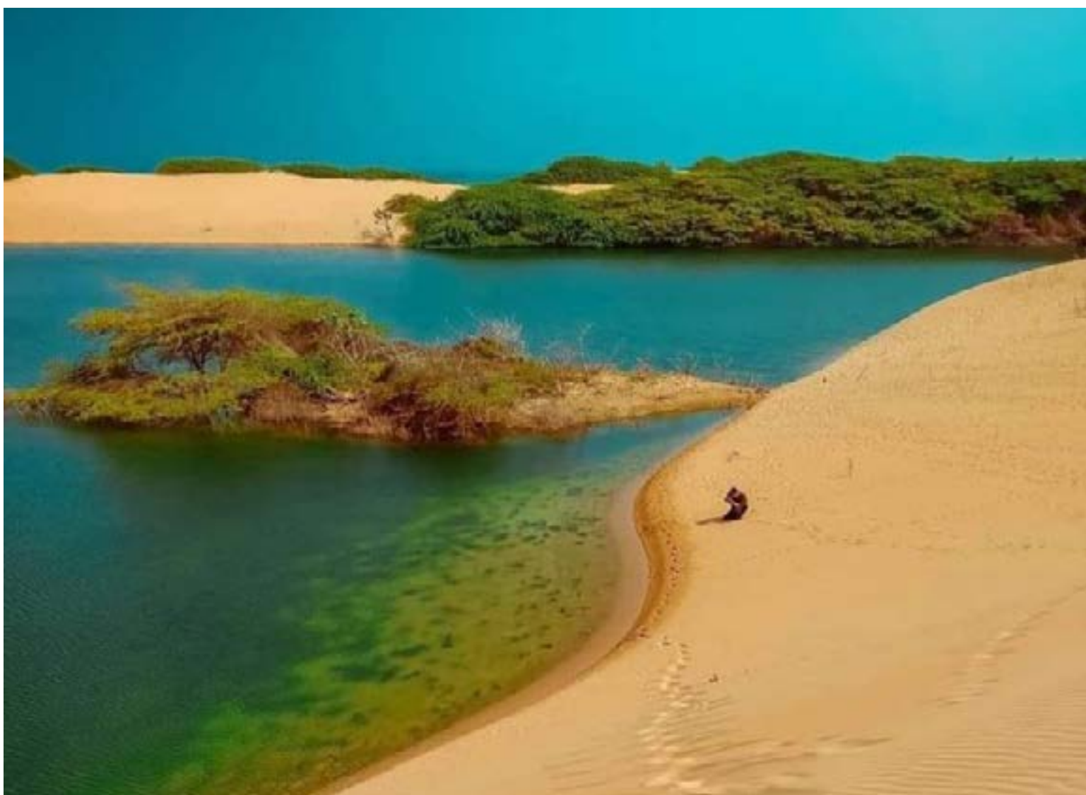
La Laguna de los Patos es atractivo es una de las maravillas de la naturaleza debido a los colores del agua y de la arena rojiza y dorada del desierto.

La naturaleza ha sido benigna con La Guajira especialmente en la zona denominada Punta Gallinas, los sitios donde habitan los indígenas Wayúu, donde llegan visitantes de Colombia y del mundo, definitivamente los visitantes nunca olvidaran los paradisíacos paisajes.