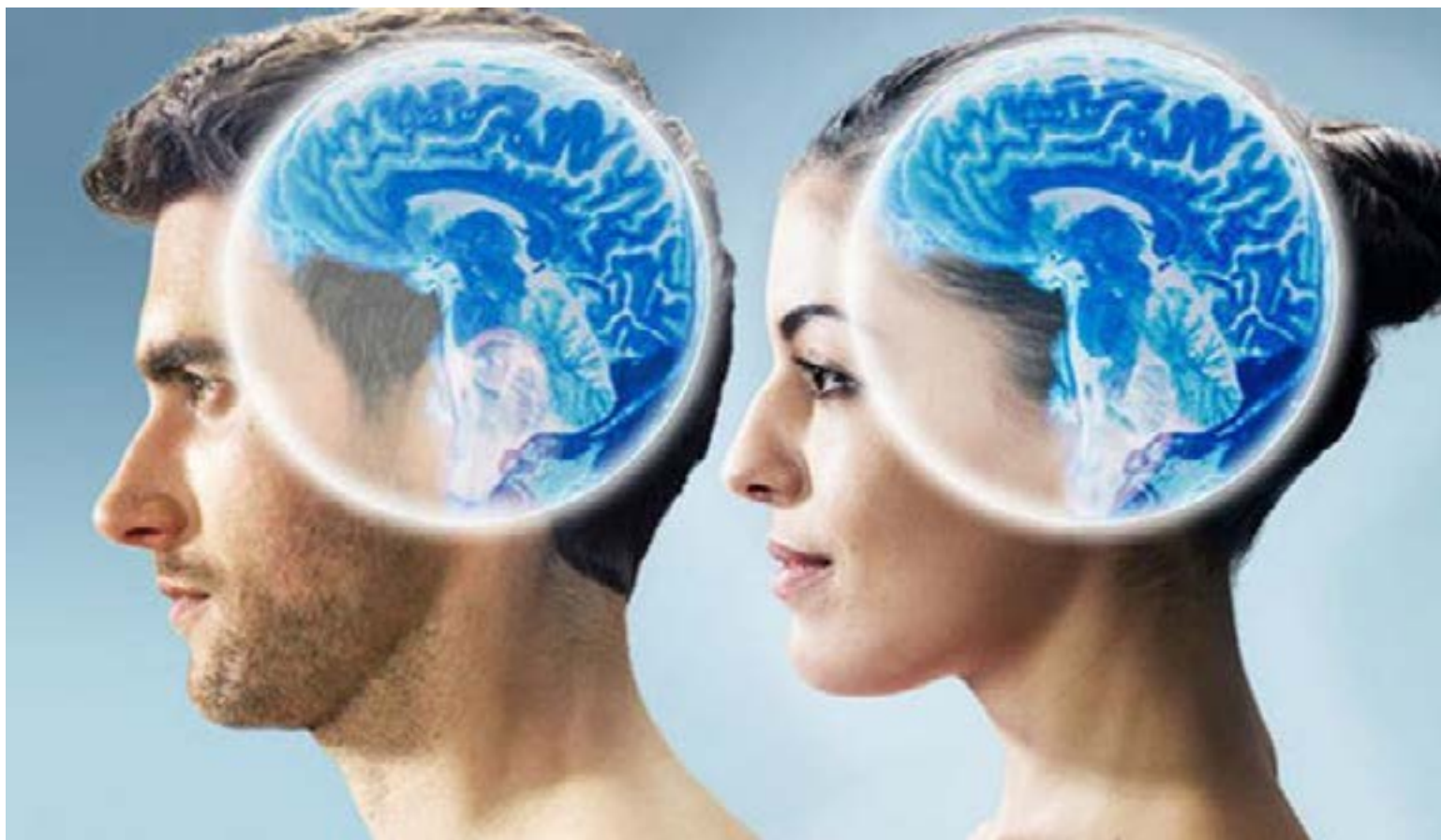
Hombre y mujer con sus respectivos cerebros